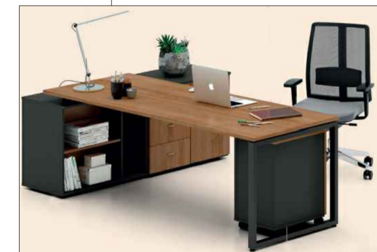
MOBILIÁRIO SALA MÁRIO