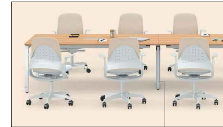
MOBILIÁRIO SALA DE REUNIÃO